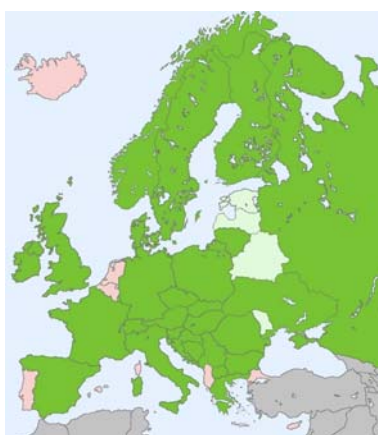
Figure 8. Carte de distribution en Europe (Fauna Europaea 2015).

Ecologie. La sangsue médicinale se rencontre dans les eaux douces de bonne qualité ; elle fréquente les mares, les étangs, les fossés, les roselières, les tourbières, les marais et les petits cours d'eau ; on la rencontre également mais plus rarement dans les sources et les eaux claires. Elle est capable de vivre quelque temps hors de l'eau, dans une atmosphère humide (2 mois dans la paille humide). Elle ne s'éloigne guère des zones aquatiques. Elle préfère les substrats sableux mais se rencontre également en zones vaseuses (Felix & Van der Velde 2000 ; van Haaren & al 2004).