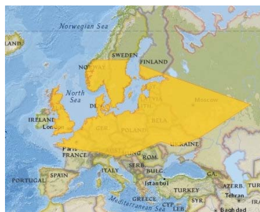
Figure 9. Carte de distribution en Europe (Utevsky & al. 2015).

Distribution géographique (Fig. 8 et 9). La distribution en Europe de la sangsue médicinale est mal connue et les cartes de distribution publiées peuvent sembler partiellement contradictoires. Cette sangsue est native d'Europe centrale et a été introduite au Moyen-âge dans les pays proches (Olsen & al. 2000) ; elle se rencontre actuellement essentiellement en zone tempérée froide, des îles britanniques à l'Oural (Utevsky & al. 2015).