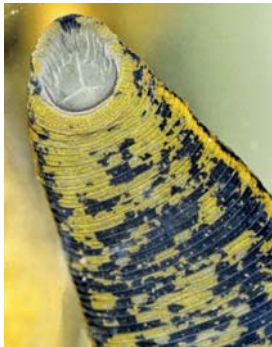
Figure 5. Région antérieure, en vue ventrale

Au niveau de la reproduction , la sangsue médicinale est hermaphrodite ; elle a 9 paires de testicules, un pénis excertile et une seule paire d'ovaires. La ponte peut intervenir plusieurs mois après l'accouplement. Le développement des embryons dans les œufs s'effectue dans le cocon (Manaranche 1977). L'accouplement a lieu au printemps, après quoi les sangsues quittent l'eau pour aller pondre dans la terre humide leur cocon qui contient une dizaine d'œufs ; après l'éclosion, les jeunes vont se nourrir de sang d'insectes, d'amphibiens et de poissons ; ces sangsues atteignent leur taille définitive dans leur 5 e année (Delphy 1935 ; Sire 1957).