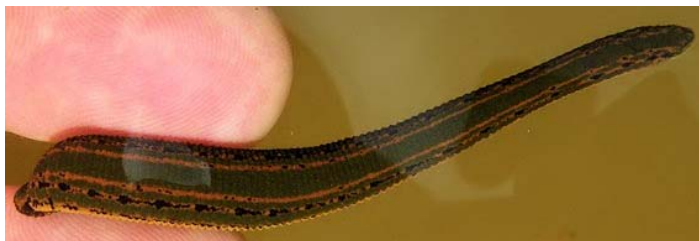
Figure 10. St Nicodème, Côtes d'Armor, 27-08-2011