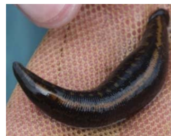
Figure 4. Individu à coloration atypique, vue dorsale. (Doville, Manche)

Anatomie. La sangsue médicinale possède deux assises musculaires circulaires et longitudinales, des muscles obliques et des muscles ventraux-dorsaux qui confèrent à l'animal une capacité contractile hors du commun ; elle est capable de se rétracter de 10 fois sa longueur. L'appareil digestif comporte des coecums latéraux où la digestion des aliments s'effectue. Bouche et pharynx comportent des différenciations remarquables : la bouche est située au centre de la ventouse antérieure (Fig. 5 & 6) et elle comporte trois mâchoires chitineuses denticulées ayant l'aspect de demi-lunes et qui portent 100 à 150 dents. Les mouvements alternatifs en "scie" de ces mâchoires entaillent la peau des proies en pratiquant une incision dont la forme en "Y" est très caractéristique. Le pharynx musculeux assure l'aspiration du sang des proies. L'appareil buccal est complété par des glandes salivaires dont la sécrétion est anticoagulante grâce à une molécule particulière, l'hirudine, un