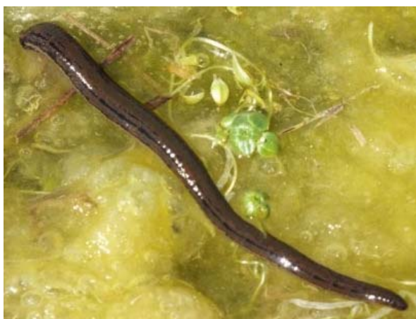
Figure 1. La sangsue médicinale ( Hirudo medicinalis ) ; individu en extension maximale. (Saint-Come-du-Mont, Manche)

Classification : Phylum Annelida Lamarck, 1809 > Classe Clitellata Michaelsen, 1919 > Sous-classe Hirudinea Lamarck, 1818 > Infra-classe Euhirudinea Lukin, 1956 > Ordre Arhynchobdellida Blanchard, 1894 > Famille Hirudinidae Whitman, 1886 > Genre Hirudo Linnaeus 1758. (INPN 2015 ; WoRMS 2015).