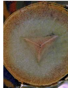
Figure 6. Ventouse antérieure en vue ventrale, montrant la bouche en forme de "Y".

Identification / Risques de confusion et espèces voisines. Différentes clés d'identification ont été proposées pour les sangsues d'Europe, dont H. medicinalis (Mann 1964 ; Utevsky & Trontelj 2005 ; d'Hondt & Ben Ahmed 2009) ; un site web peut être utile également pour les identification ( Perla 2015 ). Pour les identifications d'après photo , il est important de photographier à la fois la face dorsale et la face ventrale dont la couleur est importante pour distinguer les espèces.