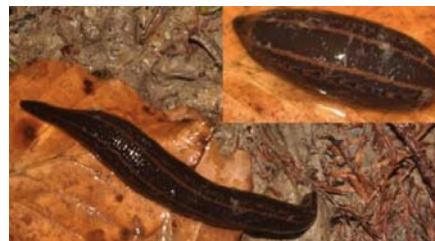
Fig. 11. Mare aux Evées, F. de Fontainebleau, 1-4-2015 © F. Serre-Collet.