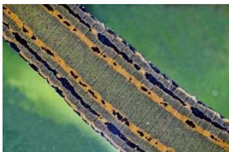
Figure 2. Vue dorsale, détail montrant les bandes colorées oranges et noires