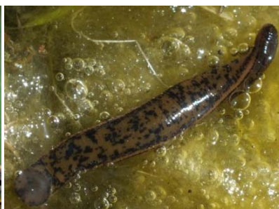
Figure 3. Vue ventrale montrant la pigmentation "en mosaïque". (Saint-Come-du-Mont, Manche)