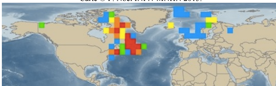
Carte © OBIS 2015.