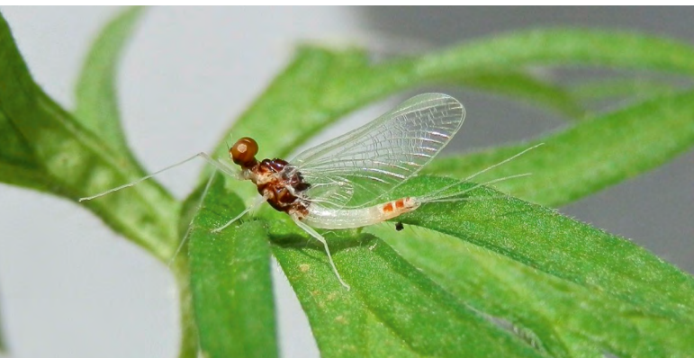
■ Serratella mesoleuca , une espèce de la Loire "En danger" et en déclin, menacée par l'aménagement des cours d'eau, l'entretien par dragage, l'artificialisation des berges et le rejet d'eau chaude des centrales nucléaires, qui altèrent la qualité de son habitat.

Transformant la matière végétale (principalement des algues microscopiques) en matière animale, les éphémères se situent à la base de la chaîne alimentaire. Ils sont la proie d'un grand nombre d'animaux qui consomment aussi bien les larves que les adultes : libellules, punaises d'eau, poissons, oiseaux ou encore chauves-souris. Du fait de leur respiration aquatique assurée par des branchies, les larves sont particulièrement fragiles à la pollution et à l'élévation de la température. Ces insectes sont ainsi de très bons bio-indicateurs de la qualité des milieux d'eau douce.