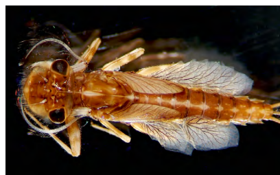
■ Larve d' Arthroplea congener , une espèce rare classée "En danger critique", sensible à l'impact du drainage et du pompage qui modifient les niveaux hydriques et assèchent les cours d'eau, ainsi qu'à l'exploitation forestière.

effluents industriels, dont ceux des eaux de refroidissement des centrales nucléaires, menacent particulièrement les éphémères. C'est le cas également des effluents dus aux activités touristiques saisonnières, comme dans les campings ou les stations de montagne, aux structures d'épuration parfois sous-dimensionnées. L'exploitation forestière altère aussi la qualité du milieu, lorsqu'elle repose sur des essences modifiant l'acidité des sols. Enfin, ces espèces liées aux eaux douces subissent l'impact des usages de l'espace à grande échelle, comme le lessivage des sols dû à l'agriculture intensive, le drainage des terres cultivées et l'extension des surfaces urbaines imperméabilisées.