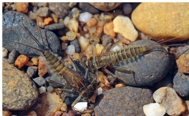
■ Larves de Rhithrogena germanica , une espèce classée "Vulnérable" et en régression, menacée par l'urbanisation et la pollution.

La Liste rouge nationale permet de mesurer le degré de menace pesant sur chacune des espèces présentes en France. L'état des lieux a été mené par le Comité français de l'UICN et le Muséum national d'Histoire naturelle, en partenariat avec l'Office pour les insectes et leur environnement. Les analyses se sont appuyées sur les connaissances et les compétences du groupe "Opie-benthos", dédié à l'étude des insectes aquatiques. Pour chaque espèce, toutes les informations disponibles ont été compilées et examinées. La validation collégiale des résultats est intervenue lors d'un atelier d'experts organisé en février 2018, au cours duquel la catégorie de chaque espèce a été déterminée selon la méthodologie de l'UICN. Le bilan synthétique de ces évaluations est présenté ci-dessous.