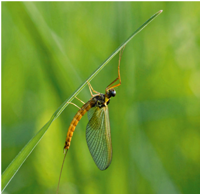
■ L'espèce Metreletus balcanicus , classée "Quasi menacée", est victime de l'intensification des pratiques agricoles, de la mise en culture de terrains en tête des bassins versants et localement du curage de ruisseaux temporaires et de fossés.