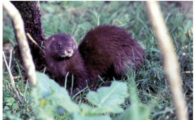
■ Le Vison d'Europe ( Mustela lutreola ), une espèce classée "En danger"

De plus, des évaluations complémentaires ont été réalisées pour certaines sous-espèces continentales et pour certaines populations d'espèces marines (cf. tableau p.11).