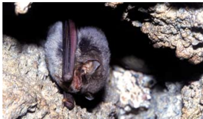
■ Le Minoptère de Schreibers ( Myotis schreibersii ), classé "Vulnérable"