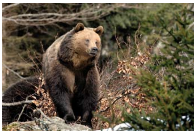
■ L'Ours brun ( Ursus arctos ), classé "En danger critique d'extinction"

NE : Non évaluée (espèce non encore confrontée aux critères de la Liste rouge)