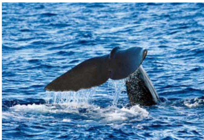
■ Le Cachalot ( Physeter macrocephalus ), une espèce "Vulnérable"

Concernant les cétacés, près de la moitié des espèces a dû être placée dans la catégorie "Données insuffisantes", en raison du manque de connaissances et de données disponibles. Pourtant, certains de ces mammifères marins pourraient bien être menacés en France, car ils sont affectés par de multiples