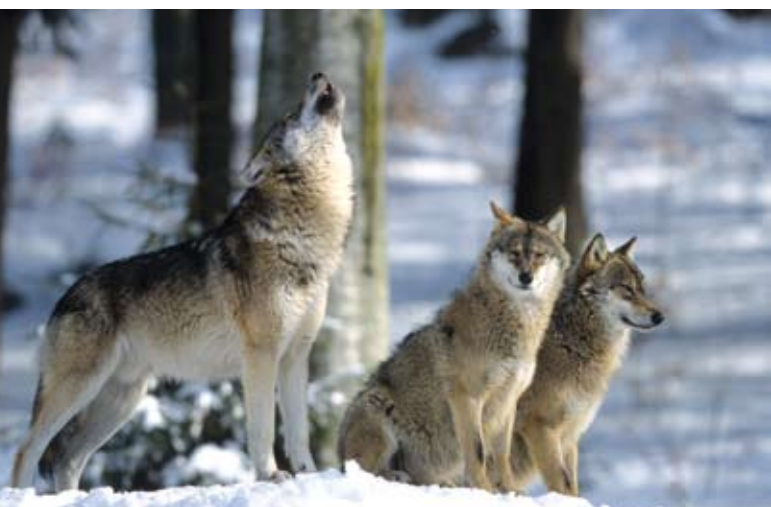
■ Le Loup gris ( Canis lupus ), une espèce classée "Vulnérable"

Malgré la situation encore préoccupante de plusieurs espèces, le résultat des évaluations montre que les actions de conservation entreprises pour les mammifères sur le territoire métropolitain portent leurs fruits (protection réglementaire nationale et européenne, plans nationaux d'action, conservation des habitats naturels...). Ces résultats encourageants incitent à poursuivre les efforts et à renforcer l'action pour continuer à améliorer, dans les années à venir, la situation de ces espèces.