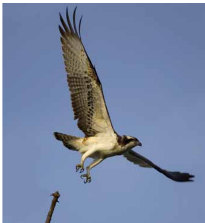
■ Balbuzard pêcheur ( Pandion haliaetus ), rapace dont la population nicheuse est "Vulnérable" en France

L'évaluation des menaces pesant sur les 277 espèces d'oiseaux nicheurs en métropole révèle une situation très préoccupante : 73 d'entre elles sont actuellement menacées sur le territoire, soit plus d'une espèce sur quatre. L'intensification des pratiques agricoles et la régression des prairies naturelles ont entraîné le déclin de nombreuses espèces. C'est le cas du Râle des genêts, marqué par une diminution de 50% de ses effectifs en 10 ans et classé "En danger", et de la Pie-grièche à poitrine rose, qui ne compte plus aujourd'hui que 30 à 40 couples en France et classée "En danger critique".