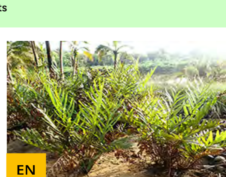
Acrostich doré ( Acrostichum aureum )