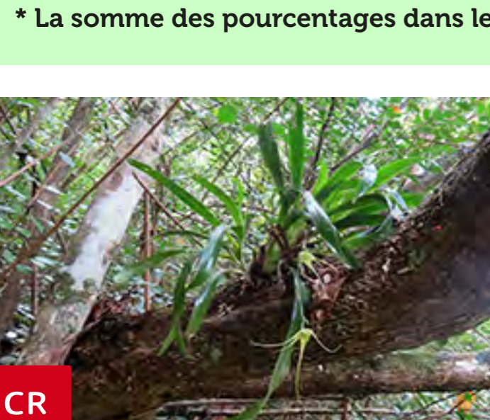
Aéranthe caudée ( Aeranthus caudata )