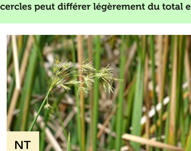
Souchet articulé ( Cyperus articulatus )