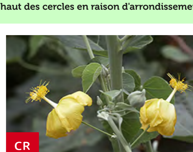
Mauve ( Abutilon exstipulare ) © Vincent Bouillet